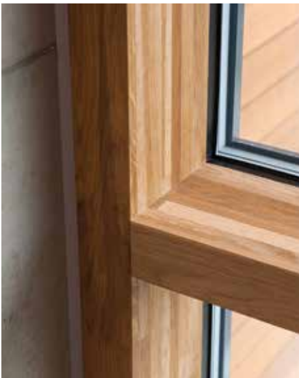
MFH Detail Treppenhaus