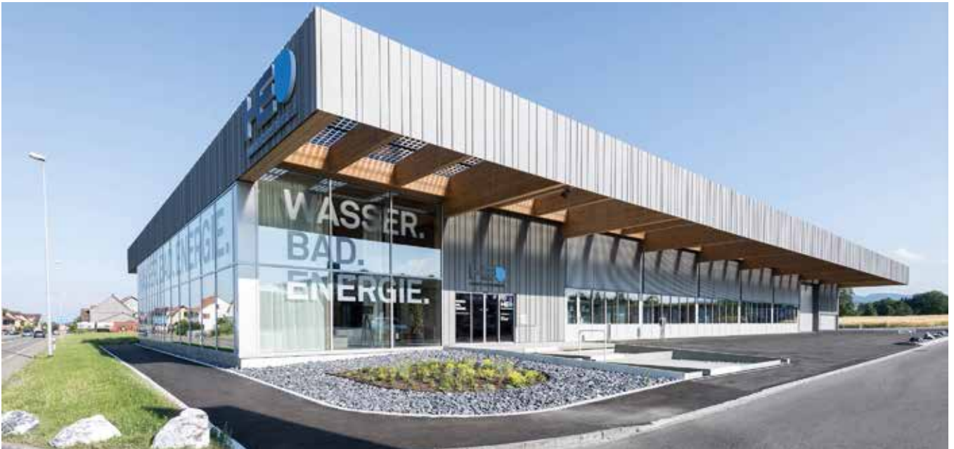
Haustechnik Eugster Arbon