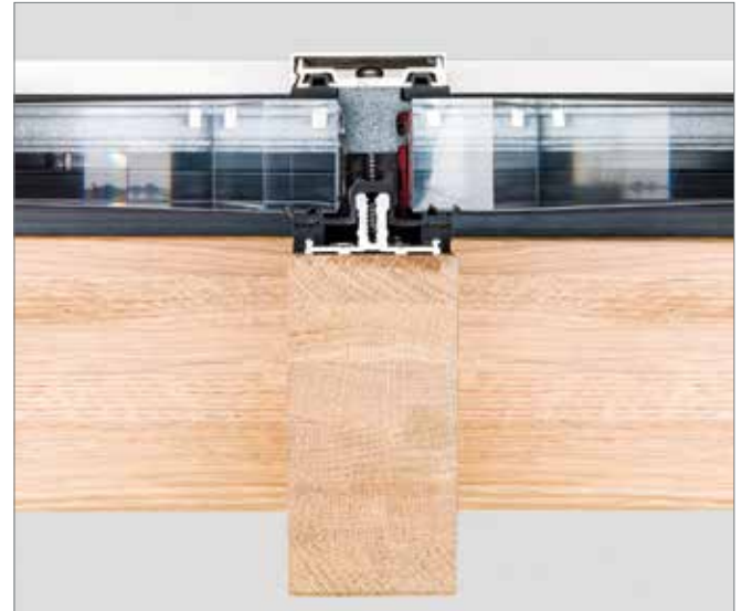
Pfosten-Riegel-System mit amerikanischer Eiche