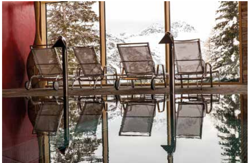
Wellnessbereich Hotel Prättschi, Arosa

Der Anspruch an eine Gebäudehülle, möglichst grossflächige und lichtdurchflutete Räume hervorzubringen, steht nicht nur im Trend der Industriearchitektur, sondern wird immer öfters im privaten Hausbau zum Thema. Ein Wohnambiente so zu gestalten, dass Weitblick, Geborgenheit und Behaglichkeit sich mit der aussen angrenzenden Natur vereinen.