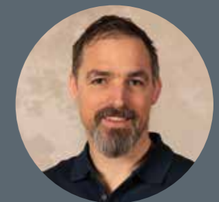
Projektleiter: Michael Koch

Wir schaffen Fensterlösungen, die traditionelle Bauwerke respektvoll ergänzen – mit der Ästhetik vergangener Epochen und der Technik von heute. Und das mit viel Feingefühl, handwerklichem Können und einem Blick fürs Ganze.