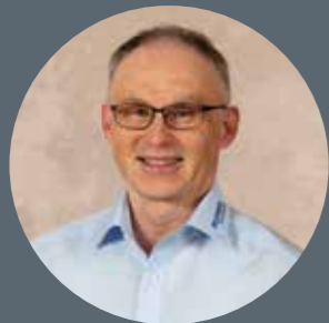
Projektleiter: Lorenz Graf