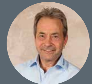
Projektleiter: Christian Rüttimann

Die präzise Verarbeitung sorgt dafür, dass es pflegeleicht bleibt und über Jahrzehnte hinweg seinen Charme bewahrt. Ein echtes Stück Natur, das Licht und Behaglichkeit ins Zuhause bringt.